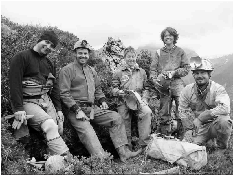
Höhlenforscher der Gruppe Schwyzerschacht während der diesjährigen Forschung vor dem kaum sichtbaren Höhleneingang.